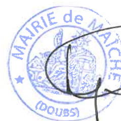
Le Maire, Régis LIGIER

PREND ACTE que le Conseil municipal aura à se prononcer ultérieurement lorsque tous les éléments seront connus pour finaliser ces procédures.